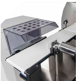
Safety photocells For a safer process, photocells for rejection confirmation and full waste basket detection are available.