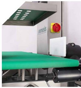
Pneumatic pusher The most versatile ejector, suitable for products from 15 g to 6 kg, across all sectors.