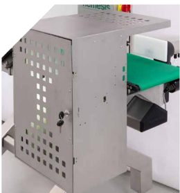
Steel reject basket with key For safely rejecting non-compliant products, with a key lock.