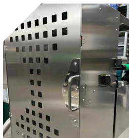
Waste basket with automatic lock Also made of steel, with the locking mechanism controlled via the control panel.