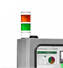
Safety devices Such as audible/visual alarm towers to signal anomalies and pressure switches for monitoring air pressure drops.