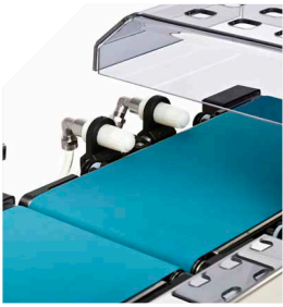
Single or double air-jet ejector Ideal for rejecting light or delicate products.