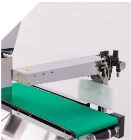
Cylinder-less pneumatic pusher Perfect for rejecting nets of fruit and vegetables or other heavy products.