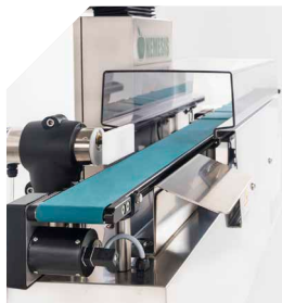
Protective tunnel Essential for compliance with GMP standards in the pharmaceutical industry, it ensures hygiene and safety.